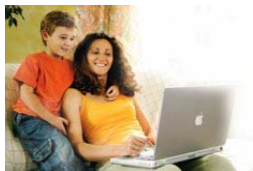
Deutsches-Shopverzeichnis.de — einfach besser werben

Anzahl der möglichen Mitbewerber in einem Newsletter bei vergleichbarem Angebot : 0