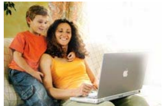
Deutsches-Shopverzeichnis.de — einfach besser werben

Mediadaten des Deutschen Shopverzeichnisses (Stand 04.2008).